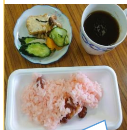
お赤飯・切干大根酢の物・漬け物

さっそく手作りの脳トレに挑戦してくださいました。真剣!! また改良してお持ちしますね。一息ついて、自慢の持ち寄り料理と一緒にいただきました。どれも美味しくてほっこり♡ ありがとうございます！