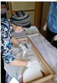
着物タンスの整理

ご依頼全てに対応することはできませんが、無理なく地域で地域を支える力を増やしていきたいと思っています。