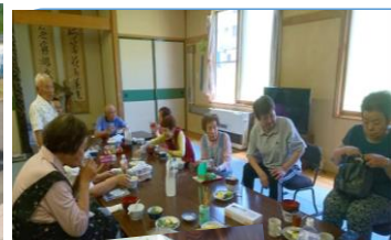
天ぷら混ぜご飯 お味噌汁

7月14日(水) 楓集会所に夕張市立診療所の研修医さんが訪問されました。いつもと変わらずテキパキと昼食を作り、おもてなしをして下さる皆さんに感謝です。先生に血糖値や足の痛みについて相談したりと交流ができました。