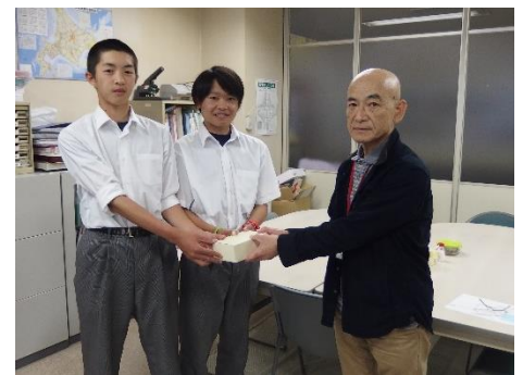
夕張市立夕張中学校生徒会 様