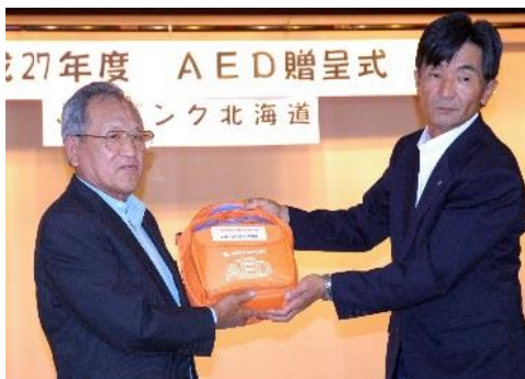
JA バンク北海道 様

J A バ ン ク 北 海 道 様 自動体外式除細動器（日本光電製 AED-2100）1台 北海道コカ・コーラボトリング株式会社 様 飲料水 23 ケース 552 本 特定非営利活動法人 札幌・障害者活動支援センターライフ 様 白い恋人 90 箱 株式会社東芝様・東芝ウィズ株式会社様・シチズンタ張様・久保田総合印刷様・大晃電気工業様 カレンダー350部・手帳 30 冊