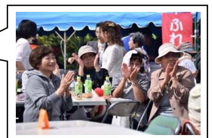
事業のようすです！