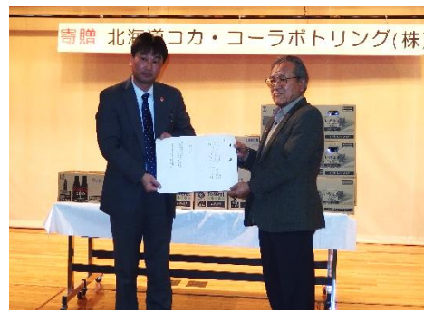
北海道コカ・コーラボトリング 株式会社 様