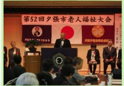
第52回夕張市老人福祉大会