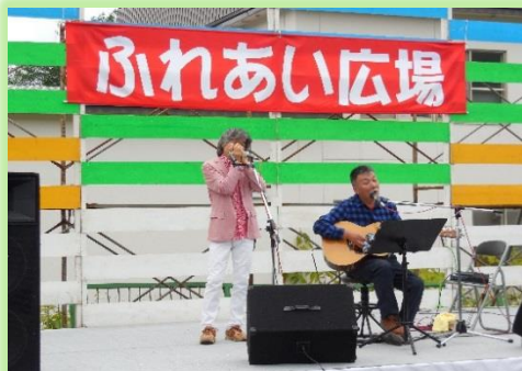
第14回ふれあい広場