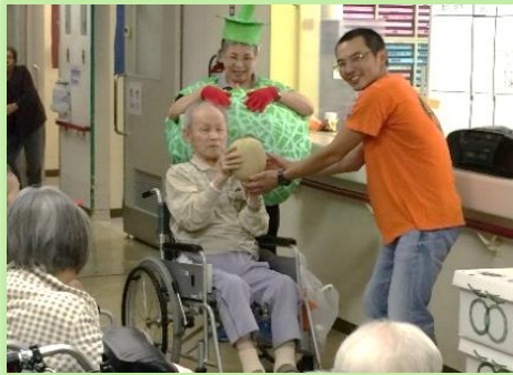
農協青年部 メロン贈呈