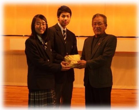
夕張市立夕張中学校生徒会 様