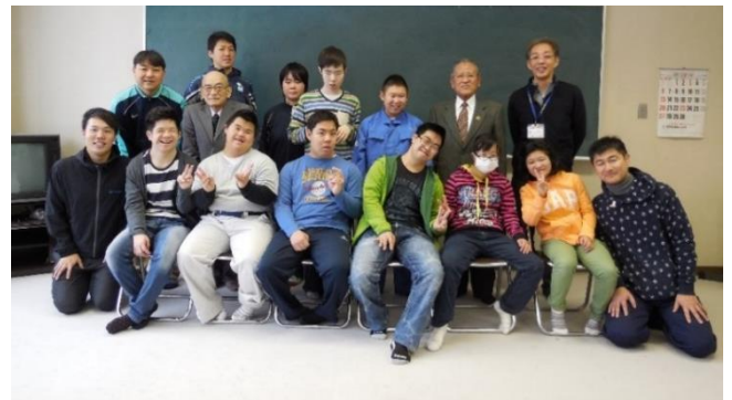
北海道夕張高等養護学校 様