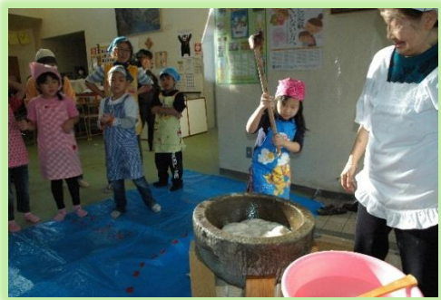
第7回世代間交流もちつき大会