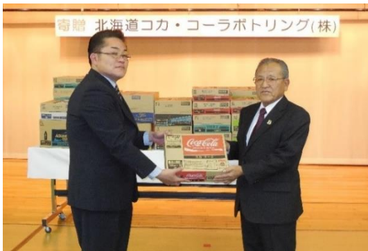
北海道コカ・コーラボトリング株式会社 様