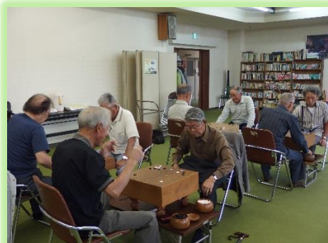
囲碁・麻雀・将棋大会