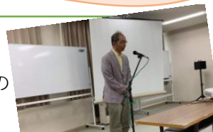
前沢市立診療所長の総評

8月24日25日、合宿の宿ひまわりにて豊生会主催の地域共同夏季セミナーが開催されました。市民と保健医療福祉関係者が一体となって新たなまちづくりを考える取り組みです。実践報告として養護学校・博愛舎・清光園の方々から、基調報告として美瑛町、京極町の方々からお話を頂きました。グループワークでは夕張の現状と共生社会についてなどの意見交流。前向きに未来を考える機会をありがとうございました。