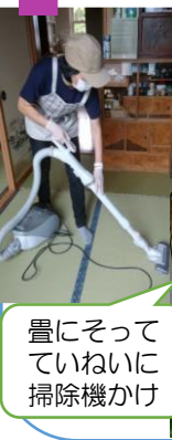
畳にそって ていねいに 掃除機かけ