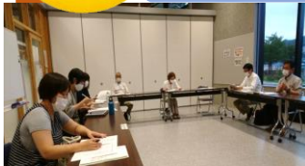
ご意見ありがとうございます