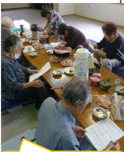
真剣に回答してくださる皆さん

8月のお手伝いは件数は少なめでしたが、窓ふきやゴミ出し、掃除機かけを行いました。何度も顔を合わせることで信頼関係が生まれお互いに緊張感なくスムーズに関わることができています。同時に「日常の困りごとに関するアンケート調査」を開始。困ったことはない…という皆さんも多いのですが、意見や要望を発見し暮らしやすい夕張へのヒントにしていきます。