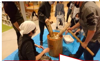
きな粉・あんこ・磯部もち

12月19日(日) 教育委員会主催のもちつき体験会がりすたで開かれ、20名程の参加者が2部に分かれて参加。鏡餅の意味、杵と臼について等、日本の伝統的な食文化を学びました。