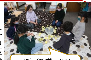
プチプチボールでよいどん！