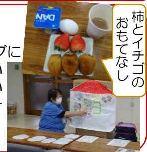
柿とイチゴのおもてなし