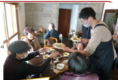
評判のくるみ食堂さんで

12月24日(金) 長寿会主催のお食事会が沼ノ沢くるみ食堂で開かれ14名の会員で賑わいました。「何にしようかな、楽しみだね」例会で予めメニューを決めて事前に注文。ボリューム満点の Pasta や サンドイッチ を頼張りながら和気あいあい新しい集いの場を喜びました