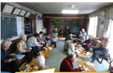
にぎわうクラブハウス

12月28日(火) 年末の紅葉山新生クラブではいつもの皆さんが集まり談笑されていました。賄い班自慢の鮭の塩焼きとあら汁がとても美味しそう！またお邪魔しますね☆