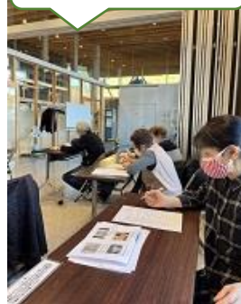
時事問題の穴埋め チャレンジ中

11/24(木)りすたにて、オレンジの会主催の「オレンジカフェ」が開催されました。認知症になりやすい人のタイプについてや自身の認知症の気づきをチェックリストで点数化したりと認知症についての知識を深めました。後半は指先を使った簡単な体操や椅子に座ってできる足の筋力維持の体操を行いました。