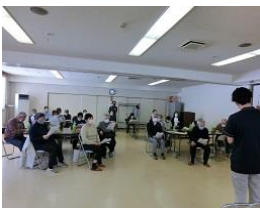
みんなで歌い振り付けも

3/28(火) 鹿の谷生活館にて3回目の地域サロン「えがお」が開催されました。豊生会の理学療法士による健康講話や機器を使った筋力量測定などを実施し、その結果に一喜一憂しながら、一年間の生活を振り返りました。市体育協会の地域おこし協力隊員による椅子に座ってできるストレッチや筋トレのほか、頭と身体を使った脳トレなど盛り沢山のサロンとなりました。今年度も開催予定です。日程が決まり次第お知らせいたします。